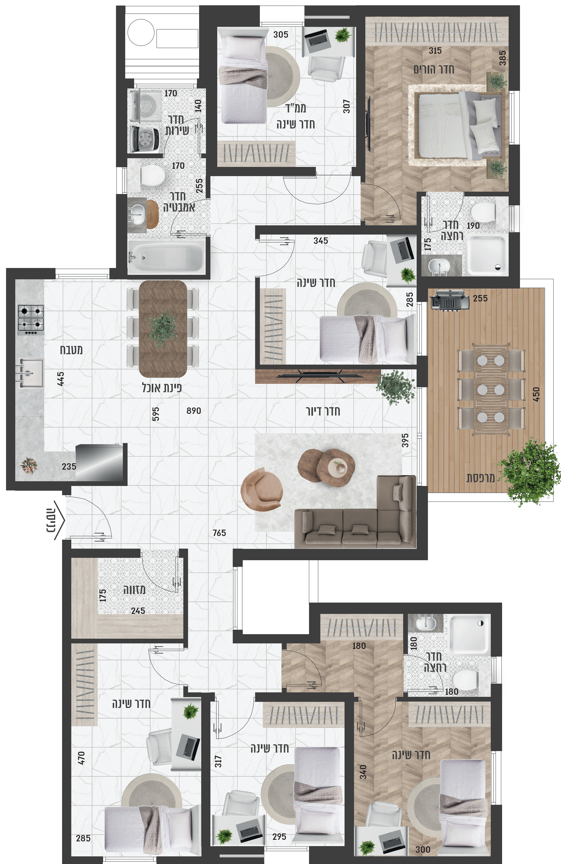
המיקום דירה בקומה משתנה בהתאם למספר הבניין עפ"י תוכנית המכר

תוכניות הדירה הינן לצורכי המחשה בלבד ואינן מהוות כל התחייבות מצד החברה. את החברה יחייבו רק חוזי המכר, המפרטים, תוכניות המכר ונספחיהם. ריהוט ארונות המטבח, כלים סניטרים, פתחי החלונות והדלתות, הינם לצרכי המחשה בלבד. המידות המוצגות הינן מידות לפני טיח ו/או כל ציפוי אחר. לפי מפרט טכני המצורף להסכם, טרם התקבל היתר בניה. * ט.ל.ח.